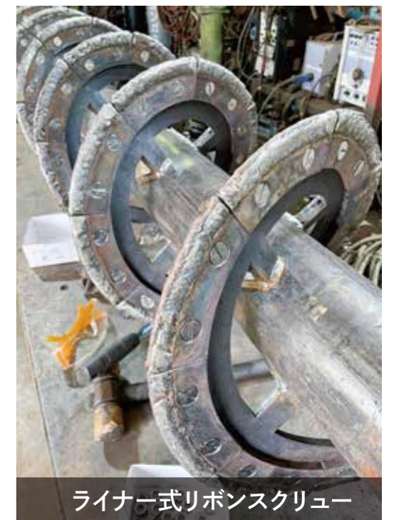
ライナー式リボンスクリー