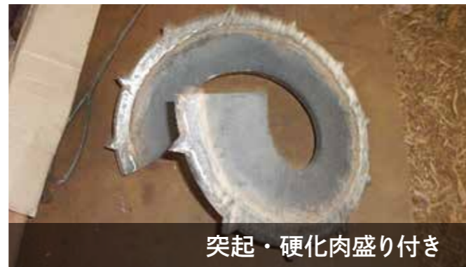
突起・硬化肉盛り付き