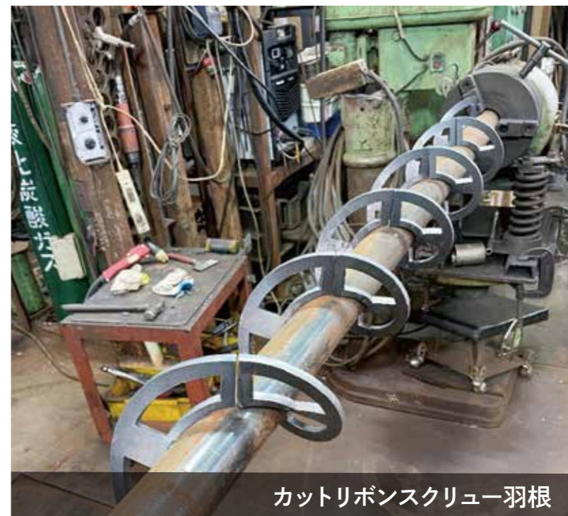
カトリボンスクリー羽根