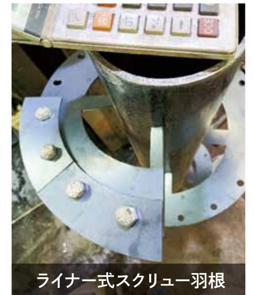
ライナー式スクリー羽根