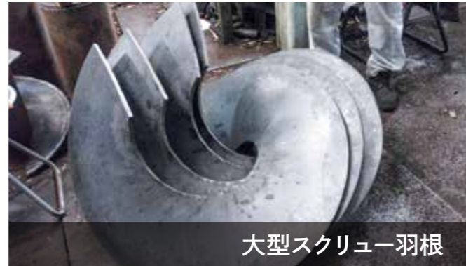
大型スクリー羽根