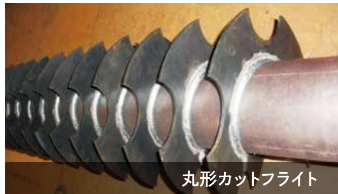
丸形カットフライト