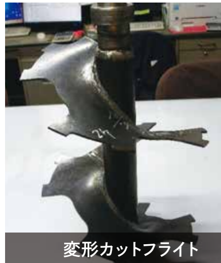
変形カットフライト