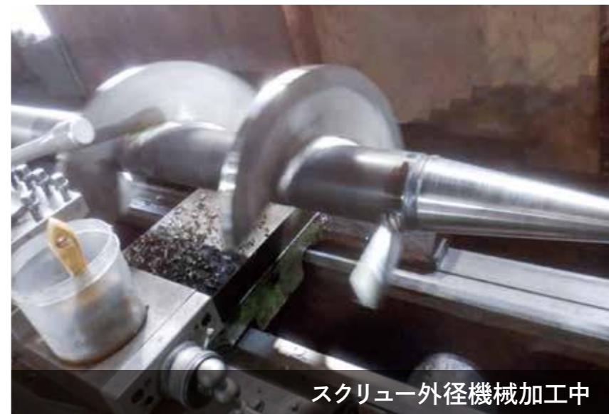
スクリー外径機械加工中

また、お客さまのニーズにお応えできるよう試作を繰り返し、リピート品からオリジナリティ溢れる軸製作までチャレンジしております。